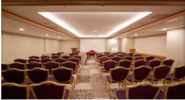
TOPLANTI VE ORGANİZASYON SALONLARIMIZ