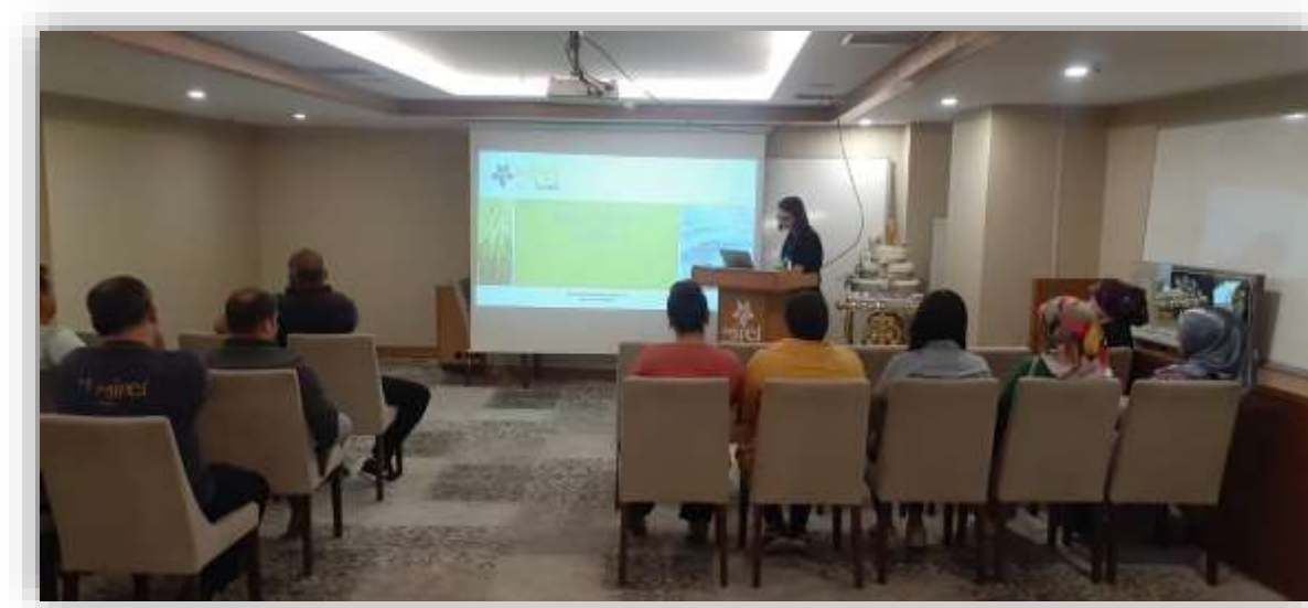
Sürdürülebilirlik Sistem Eđitimi

Sürdürülebilirlik kapsamında attığımız tüm adımlarla ilgili çalışanlarımıza bilgi aktarıyor, onları uygulamalarımıza destek vermeye davet ediyoruz